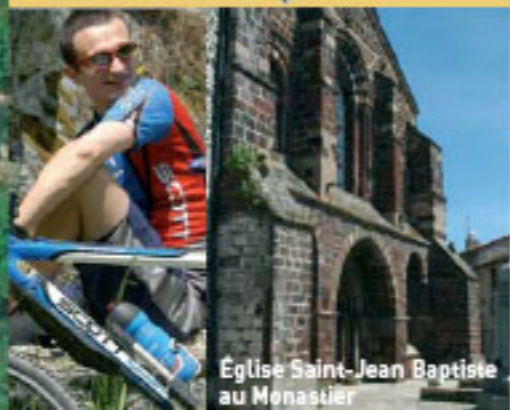
Eglise Saint-Jean Baptiste au Monastier

78 kilomètres Dénivelé positif : 1682 mètres Temps moyen : 5h00