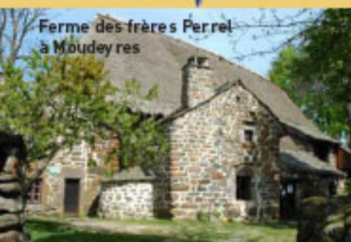
Ferme des frères Perrel à Moudeyrès

Dénivelé positif : 2140 mètres Temps moyen : 3h45